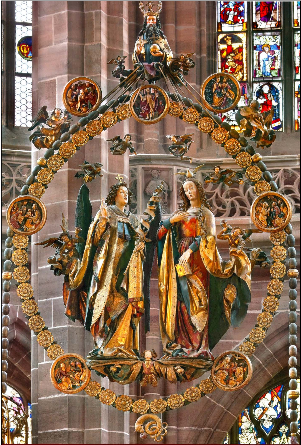
+ El Saludo del Ángel +