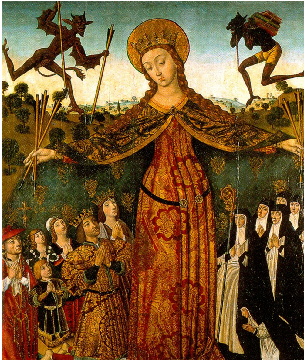
Virgen de la Misericordia gestante, coronada y nimbada