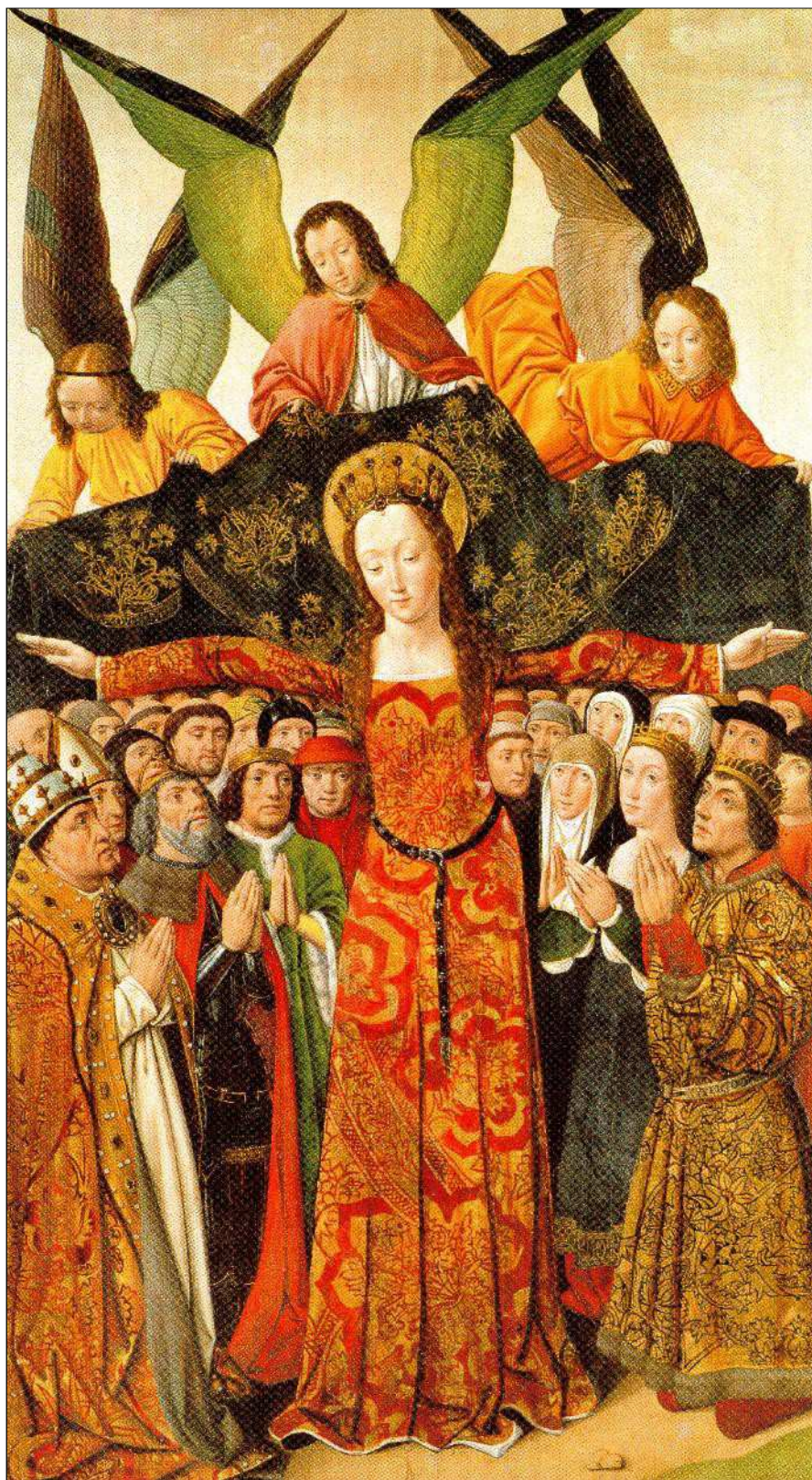
Virgen del Manto Protector