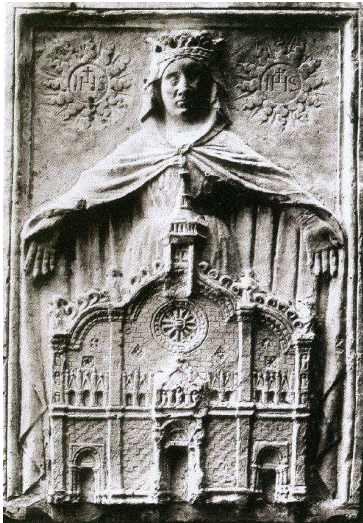
Escudo de la fábrica de la Catedral de Milán, siglo XV