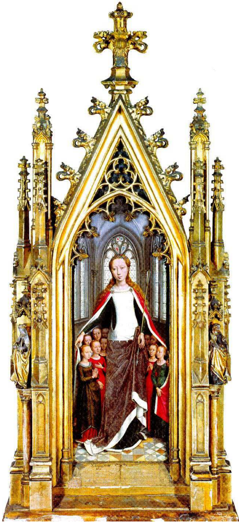
Relicario de Santa Úrsula