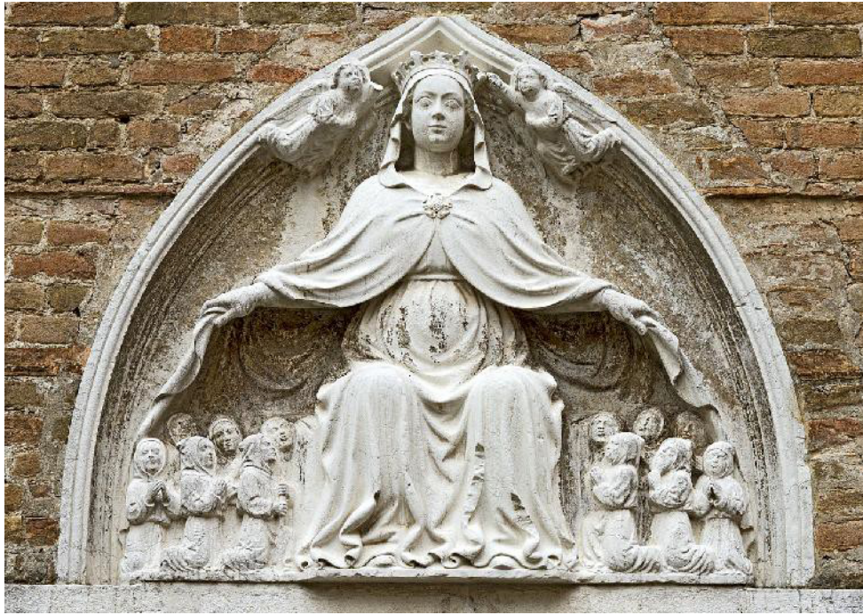
Virgen del manto protector Santo Tomás de Venecia, siglo XV