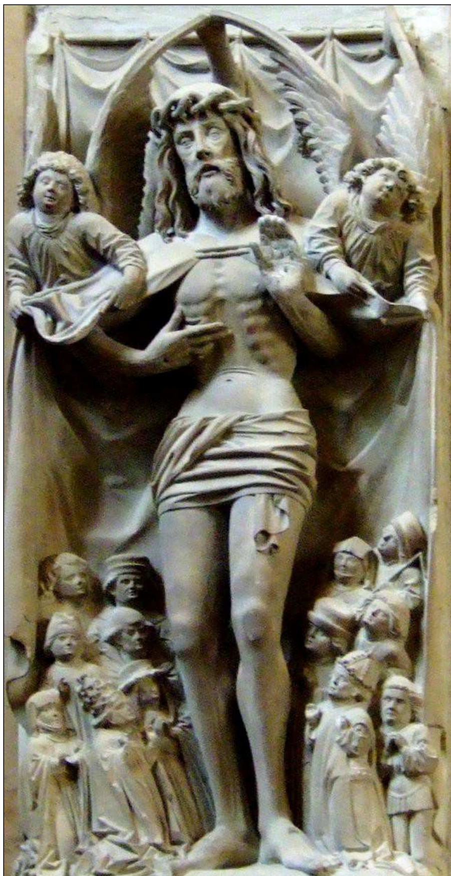
Varón de Dolores con manto protector