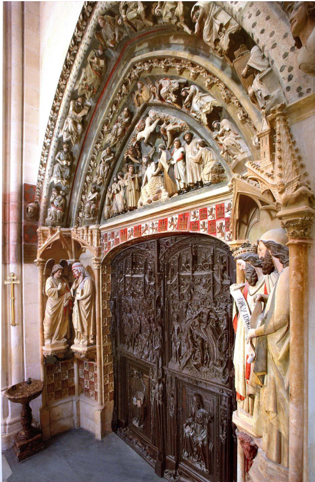
Imagen del Mes de Enero