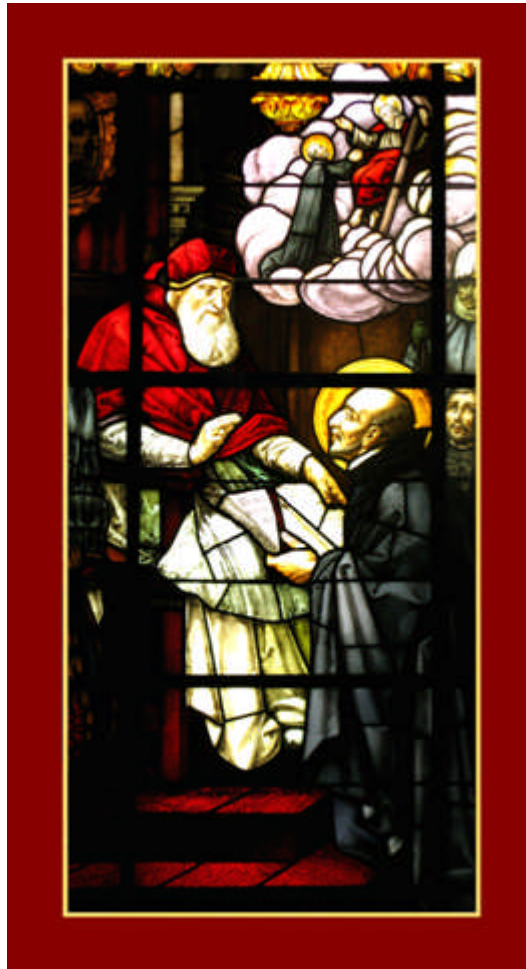
Imagen para el 31 de Julio Fiesta de San Ignacio de Loyola

En los comienzos de la Compañía de Jesús estuvo el deseo de San Ignacio y de sus compañeros, de ir a Jerusalem y allí servir al Señor. Pero ya que el plan de Jerusalem resultó irrealizable a consecuencia de la guerra de los turcos, van a Roma Ignacio y sus amigos y en 1538 se ponen a disposición del papa Paulo III para trabajar en la atención a las almas.