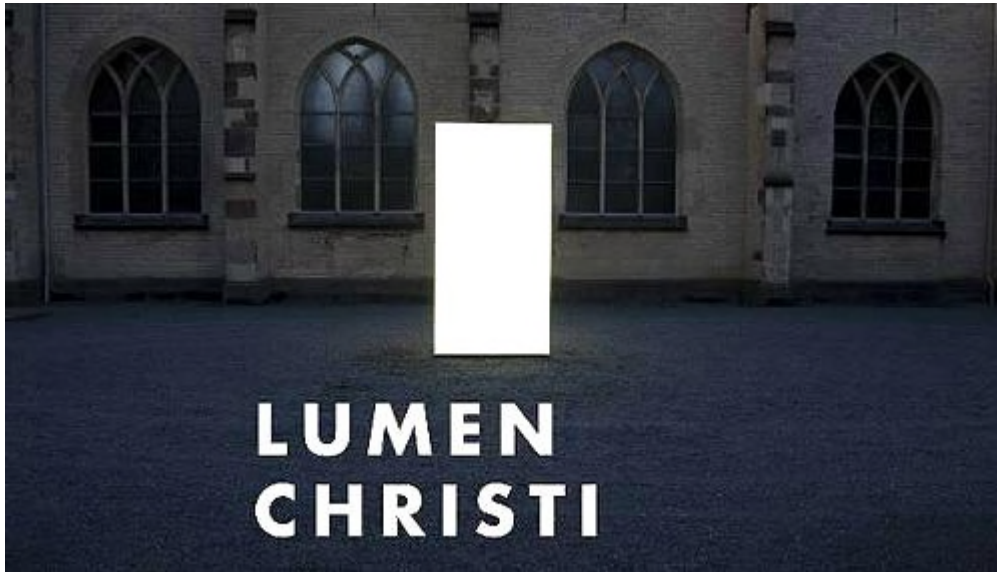
“Monolito” de Simon Ungers ESTACION DE ARTE DE SANKT PETER Préstamo de la Fundación Skulpturenpark de Colonia

Lumen Christi – con este grito de júbilo pascual, el diácono anuncia en la liturgia católica la buena noticia de la noche pascual: Cristo ha resucitado de entre los muertos. Él ha resucitado verdaderamente. Luz en las tinieblas de un mundo que está muy dominado por la muerte.