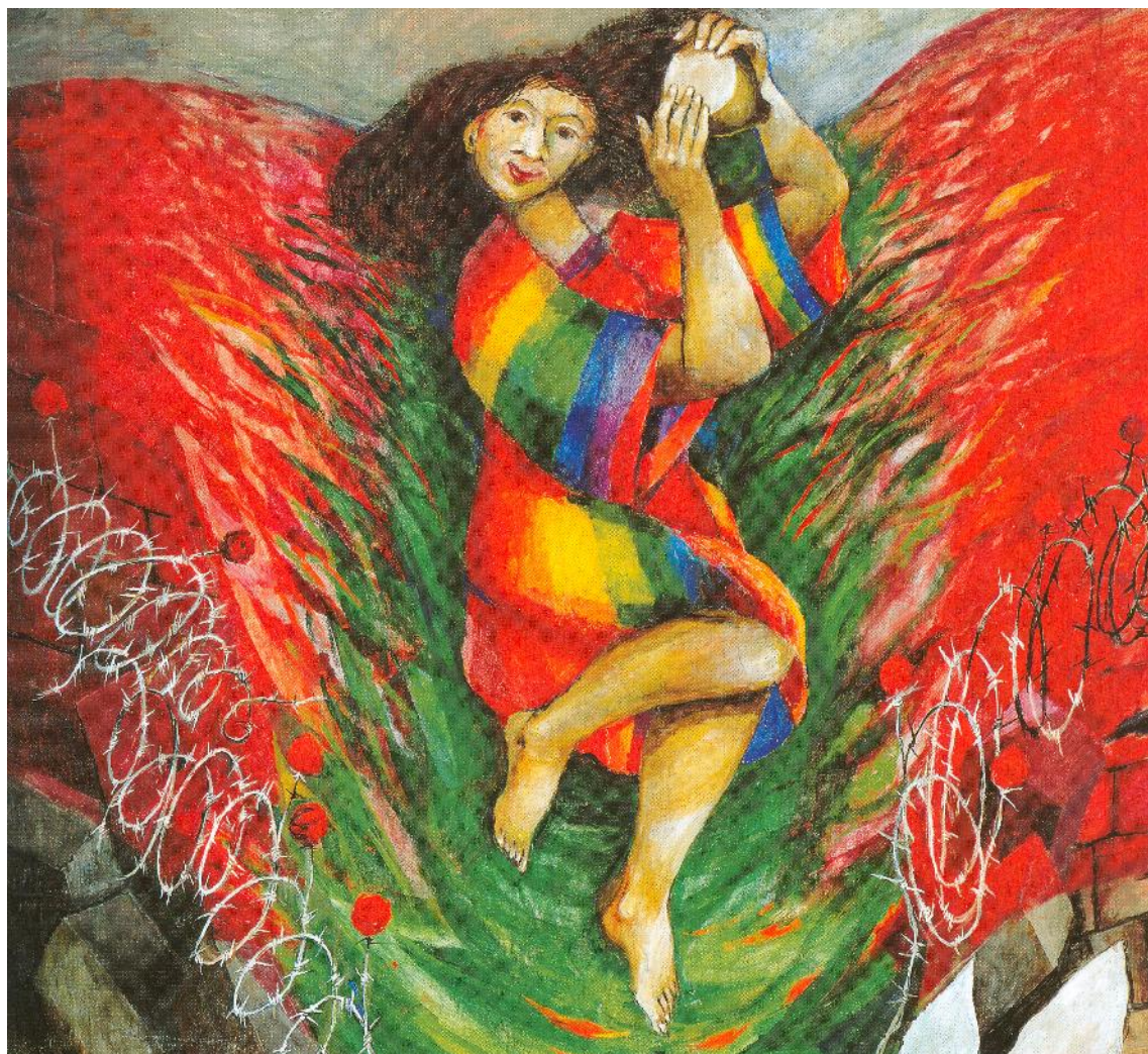
Imagen del Mes de Febrero