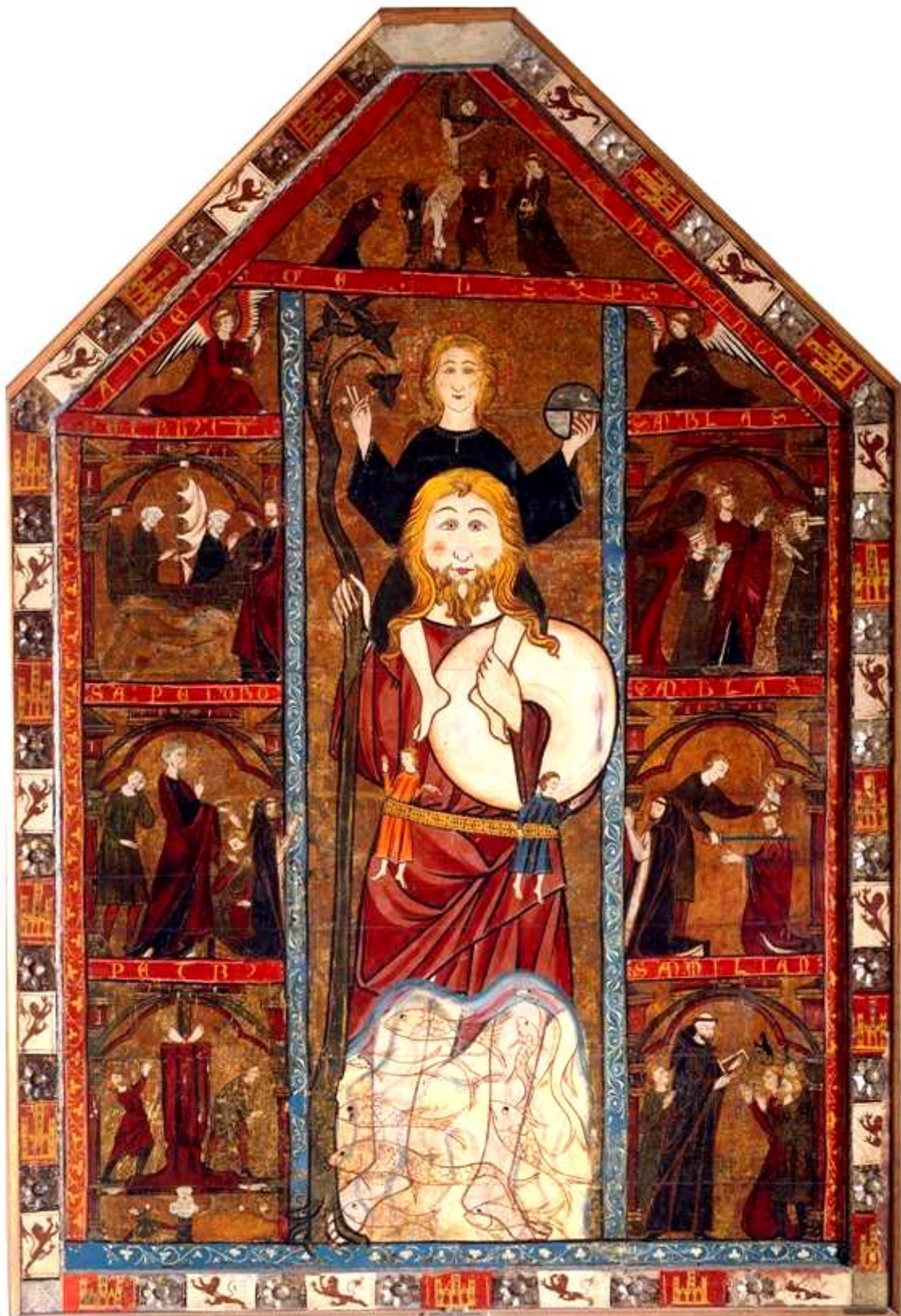
* Retablo de San Cristóbal: Ascética y Mística *