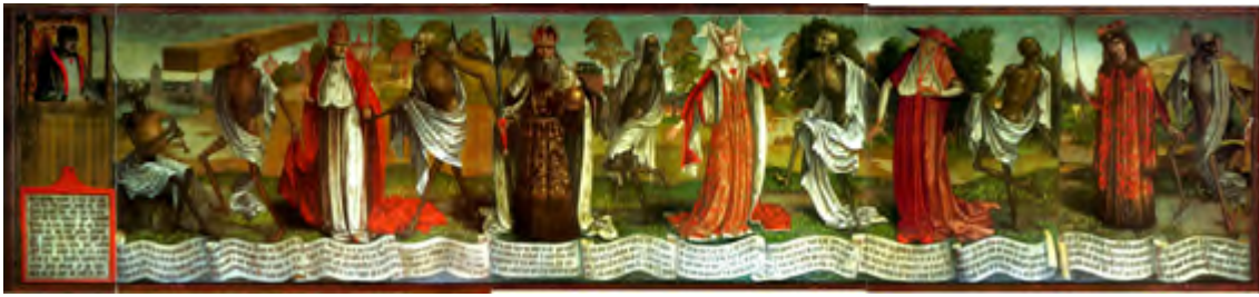
Danza macabra, siglo XV

epidemia, que reaparece en sucesivos ataques, siega la vida sin distinción de hombres y mujeres, ricos y pobres, como lo subrayan las Danzas macabras pintadas en las paredes de las iglesias y cementerios. La muerte se convierte en una obsesión.