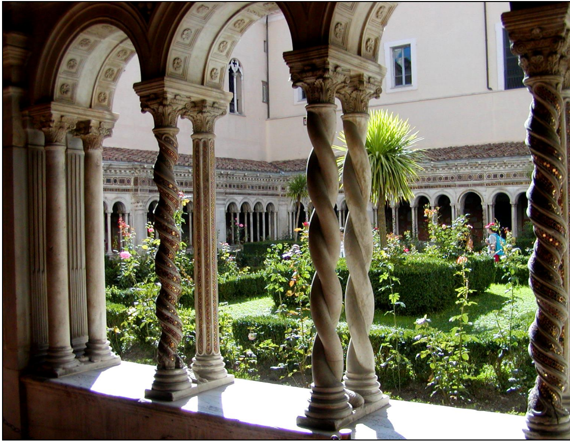
IMAGEN DEL MES DE JULIO