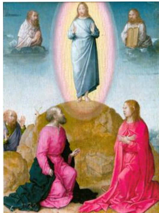
Transfiguración de Juan de Flandes