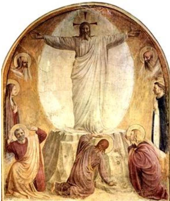
Transfiguración de Fra Angelico