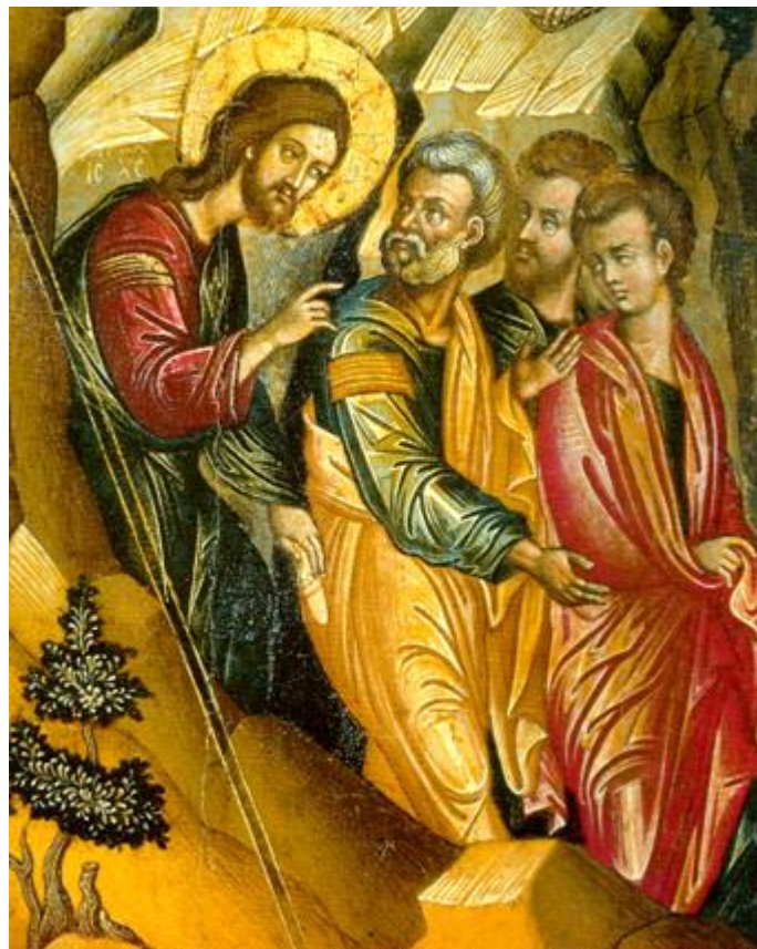
Bajando del monte santo de la T ransfiguración...