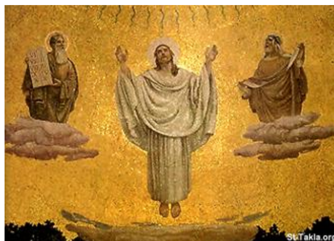
Transfiguración de la Basílica de la Transfiguración, siglo XX