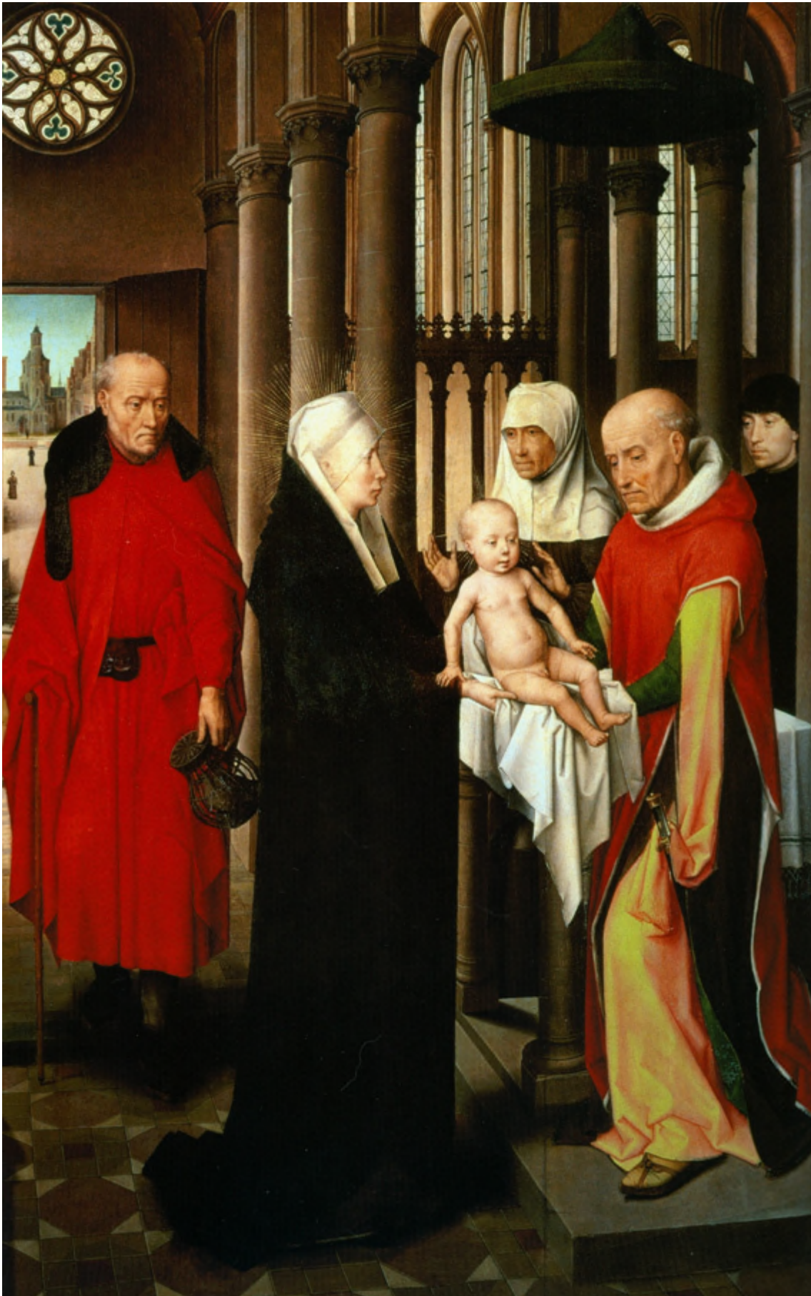
✱ PURIFICACIÓN DE MARÍA Y PRESENTACIÓN DE JESÚS EN EL TEMPLO ✱